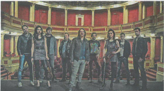
1. Blacksheep Festival in Bonfeld

Lichterfest-Familienkarten zu gewinnen Seite 15