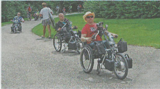
19. Rad- & Rolli-Tour