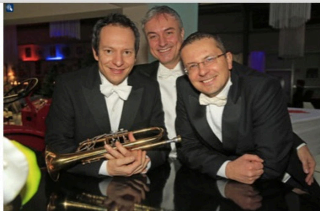
Eine Hommage an die Epoche der Ballhaus-Kultur lieferte das Trio Palazzo am Sonntag in Mayen. Für die Darbietungen gab es viel Applaus.